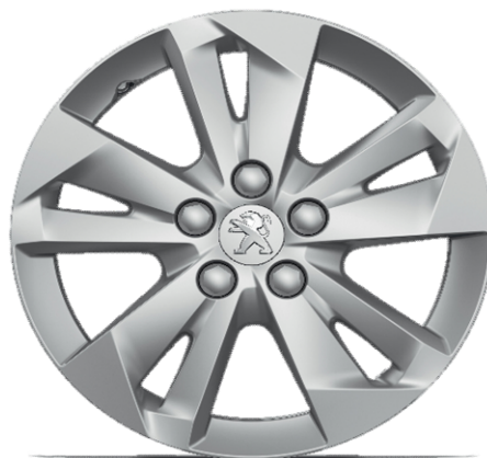
TARANAKI 15" Allure