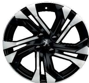
SALAMANCA 17" Allure Pack