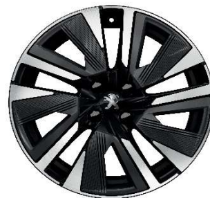
BUND 18" GT