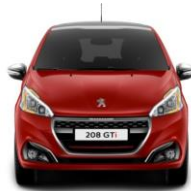
Rojo Rubi (GTi solamente)