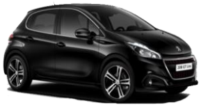
Noir Perla Nera