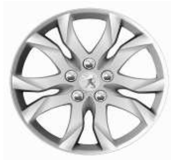
Llantas aleación 17" Allure