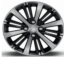
Llantas 16" Pulgadas Roland Garros