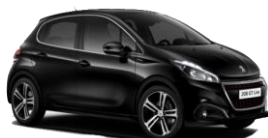
Noir Perla Nera