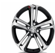
Llantas 17" Pulgadas GTi Carbone