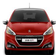
Rojo Rubi (GTi solamente)