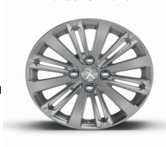
Llantas 16" Titane