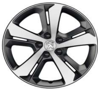
Llantas 17" Allure