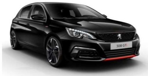
NEGRO PERLA NERA