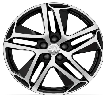
Llantas 18" Feline