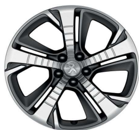
Llantas 18" RUBIS Diamantadas (bi-color) GT