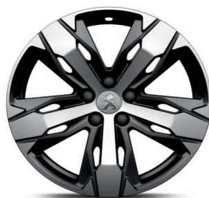
LOS ANGELES 18" Allure y GT-Line