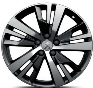
DETROIT 18" Active