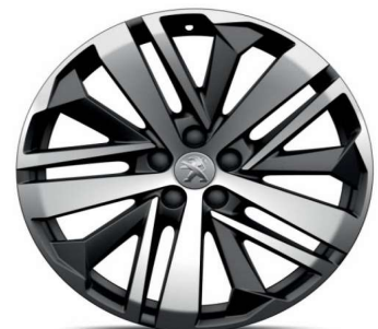
BOSTON 19" GT