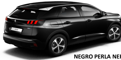
NEGRO PERLA NERA