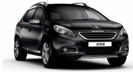
Negro Perla Nera