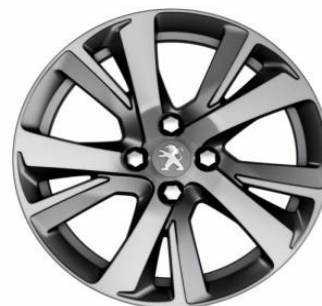
Eridan Anthra Mat Llantas 17" *según versión