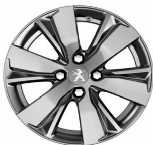
Hydre Gris Dilium Llantas 16" Active y Allure CMP